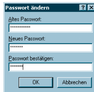
Abb. 4: Jetzt nur keinen Fehler machen – FileMaker im Blindflug

Will der Endanwender selbst sein Passwort verändern, muss er in jeder Datei drei Passworteingaben in Bullet-Schrift vornehmen – das erfährt er aber höchstens durch Zufall (Abb. 4).