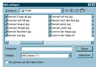
Abb. 2: Im richtigen Leben haben Bilder verschiedene Namen

Datensatzes mit einem Bild per Verweis ist auf diesem Weg gänzlich unmöglich. Zwar lässt sich die Option „Nur Verweise sichern“ im ScriptMaker ankreuzen, beim Ausführen des Scripts wird sie aber ignoriert. Für eine Datenbank dieser Preisklasse ist das ziemlich peinlich. Beide Probleme löst DialogMagic mit dem Befehl „DM-InsertPicture“ und zeigt damit, dass es nicht an der technischen Machbarkeit scheitert.