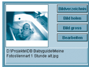
Abb. 3: Hinter jedem Knopf liegt genau die Funktion, die man hier auch erwarten darf

Was genau tut diese Script? Es berechnet zunächst die Variable V_Bildpfad als z.B. d:\bilder\1001.jpg. Anschließend weist es das Plugin an, diesen Pfad beim gleich erfolgenden Aufruf des Dialogs „Grafik einsetzen“ automatisch einzusetzen und – beachten Sie das zusätzliche Argument „|1“ – die Option „Nur Verweise sichern“ zu aktivieren. Abschließend „klickt“ das Plugin noch auf „OK“ und der Job ist erledigt.